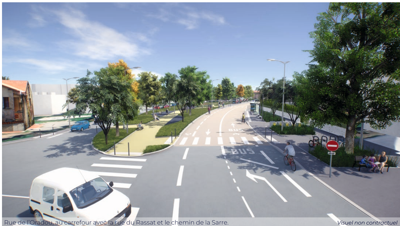
Rue de l'Oradou, au carrefour avec la rue du Rassat et le chemin de la Sarre.

L'ensemble des travaux devrait être terminé pour l'intégralité de la rue de l'Oradou en septembre 2025.