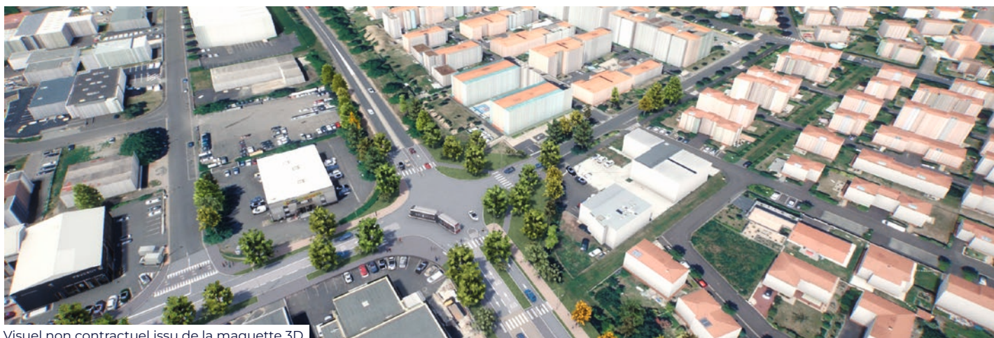
Visuel non contractuel issu de la maquette 3D