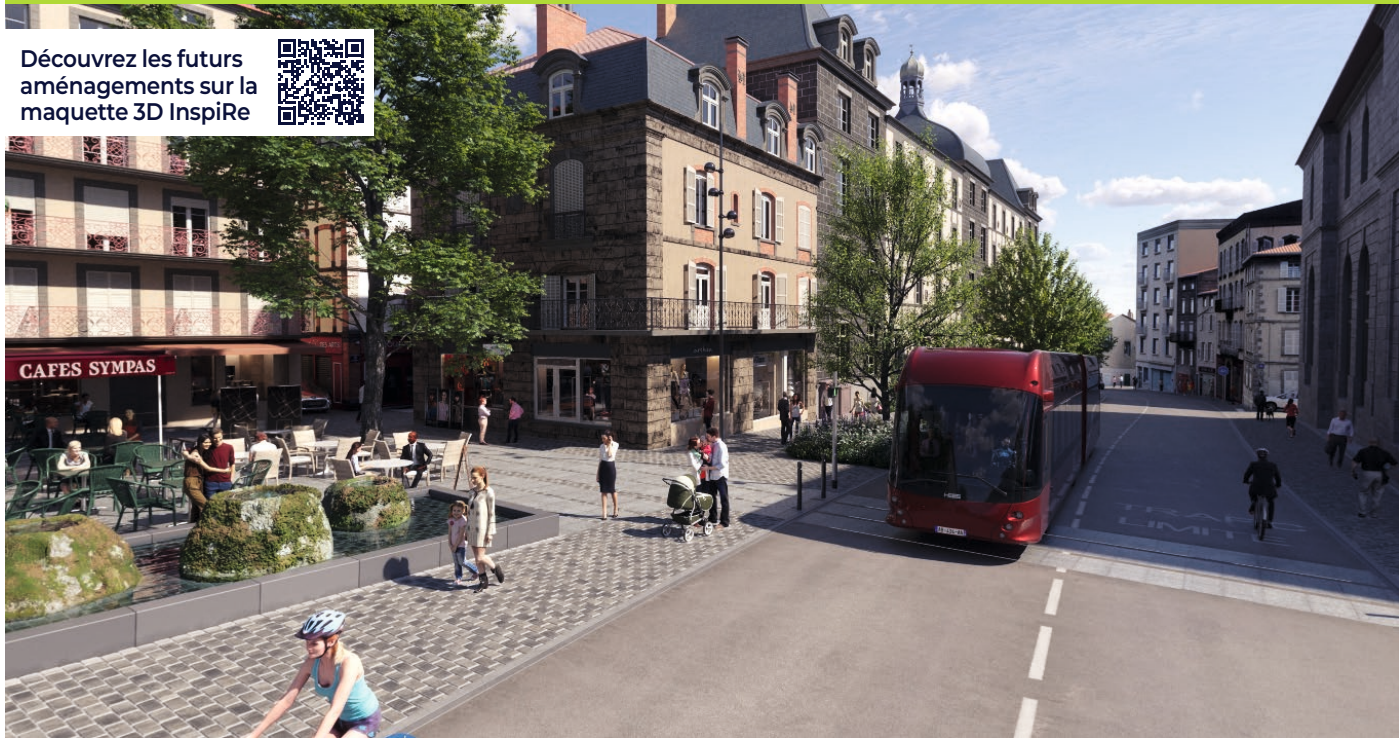
Visuel issu de la maquette 3D non contractuelle