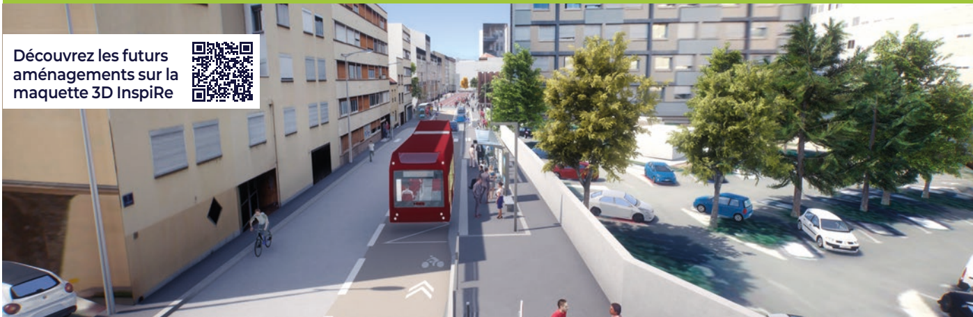
Visuel issu de la maquette 3D non contractuelle