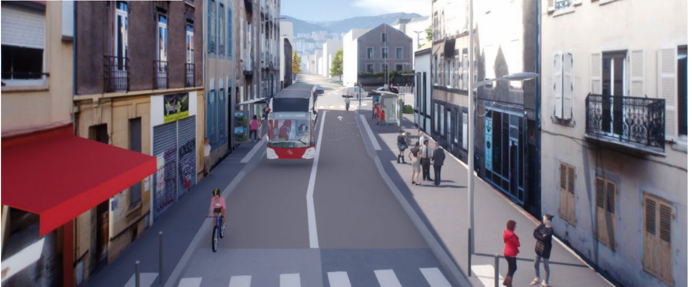
Visuel issu de la maquette 3D non contractuelle