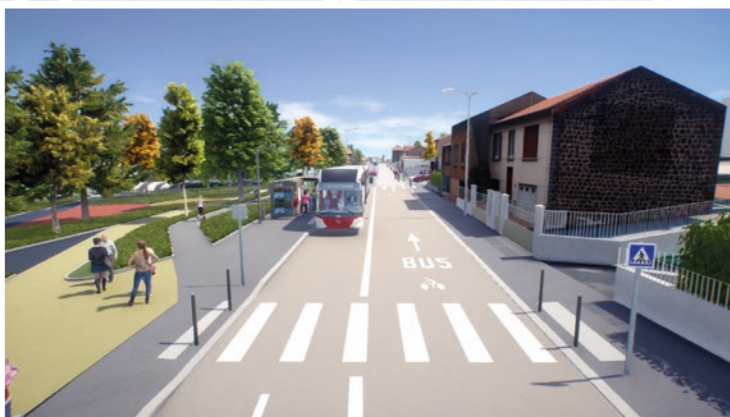
Rue de l'Oradou, arrêt du tram-bus La Sarre.*