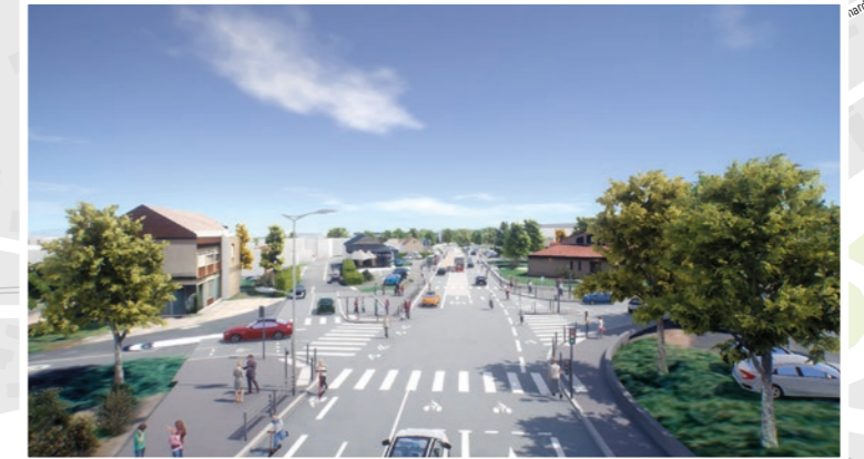
Rue de l'Oradou, à l'intersection avec la rue de la Gantière.*