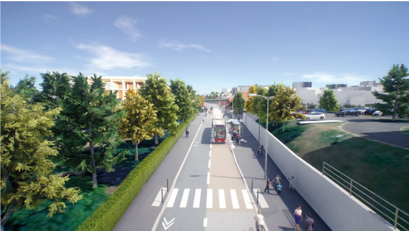
Rue de l'Oradou, arrêt du tram-bus Catherine de Médicis.