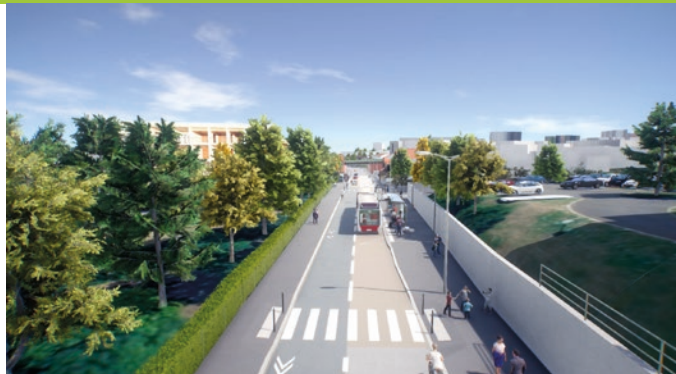
Rue de l'Oradou, arrêt du tram-bus Catherine de Médicis.

Visuel issu de la maquette 3D non contractuelle