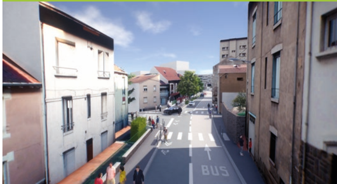
Rue de l'Oradou, à l'intersection avec la rue du Général Sarraill.

Visuel issu de la maquette 3D non contractuelle