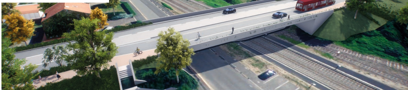
Visuel issu de la maquette 3D non contractuelle