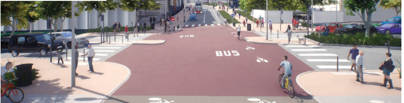
Visuel issu de la maquette 3D non contractuelle