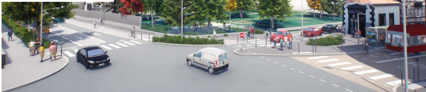
Visuel issu de la maquette 3D non contractuelle