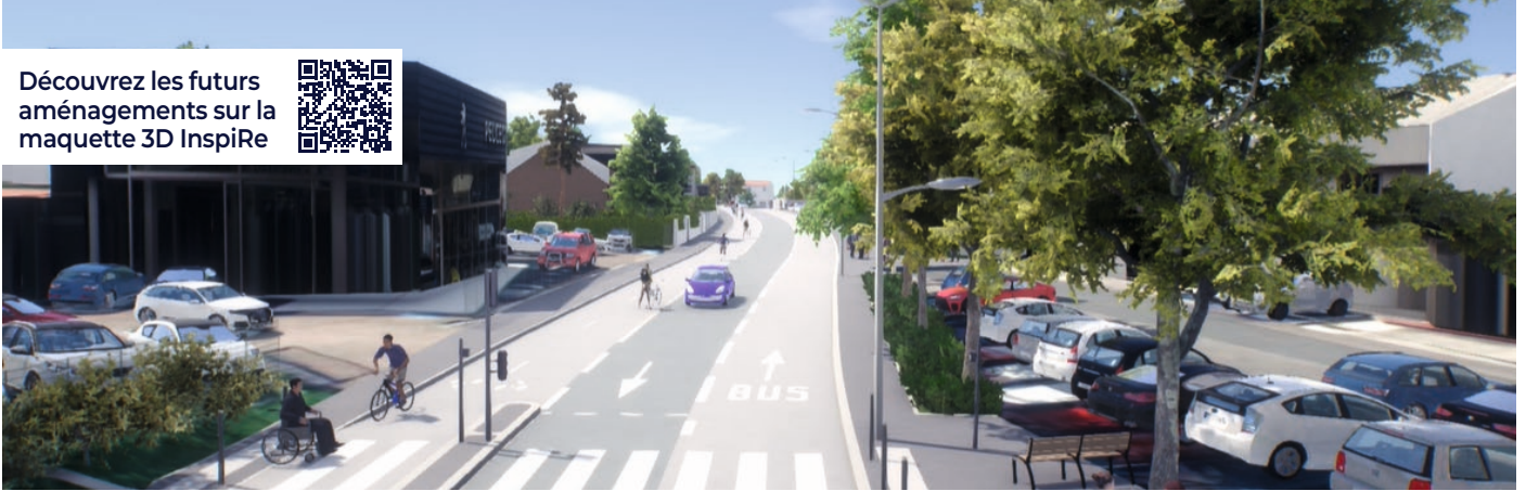
Visuel issu de la maquette 3D non contractuelle